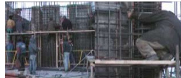
Filmstill / Still from the Film Santier/Construction Site, 2003