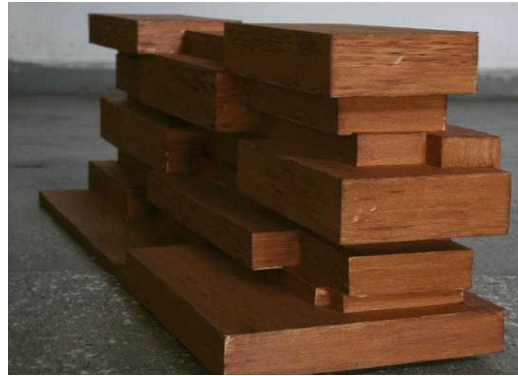
Model for the demolished Rosa Luxemburg Memorial, 2009