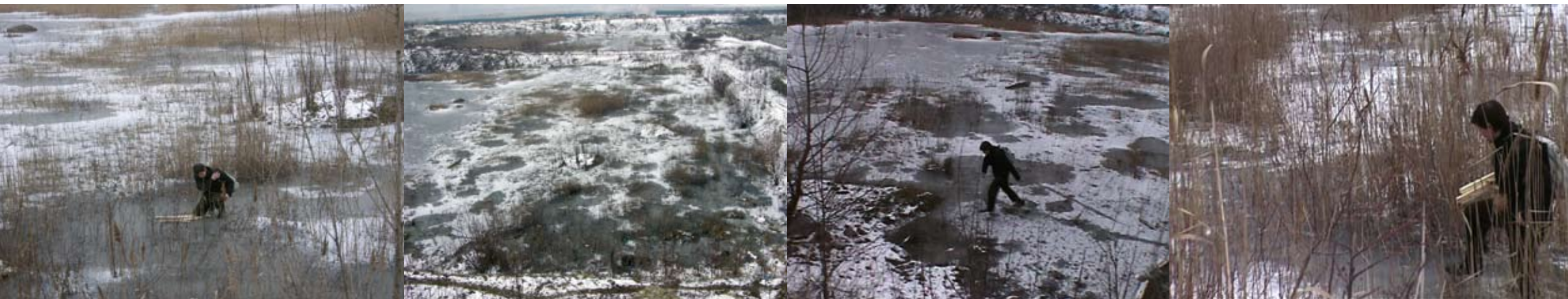
Văcăreşti 1-4, 2003

Ludwigsburg exhibition, in the year of the 300th anniversary of the foundation of this Baroque city, is therefore the “absolute city” with its specific historical structures and corresponding typology, and its current appearance and utilisation concept. The exhibition title “Dissolving Absolute Structure” refers both to Ludwigsburg as a planned Baroque city, based on the ideas of the absolutist city-founder and sovereign Duke Eberhard Ludwig, and to the socialist Bucharest, based on the megalomaniacal plans of the absolute dictator Nicolae Ceauşescu. Whereas from 1694 onwards Eberhard Ludwig had buildings constructed and people settled on free land at a former