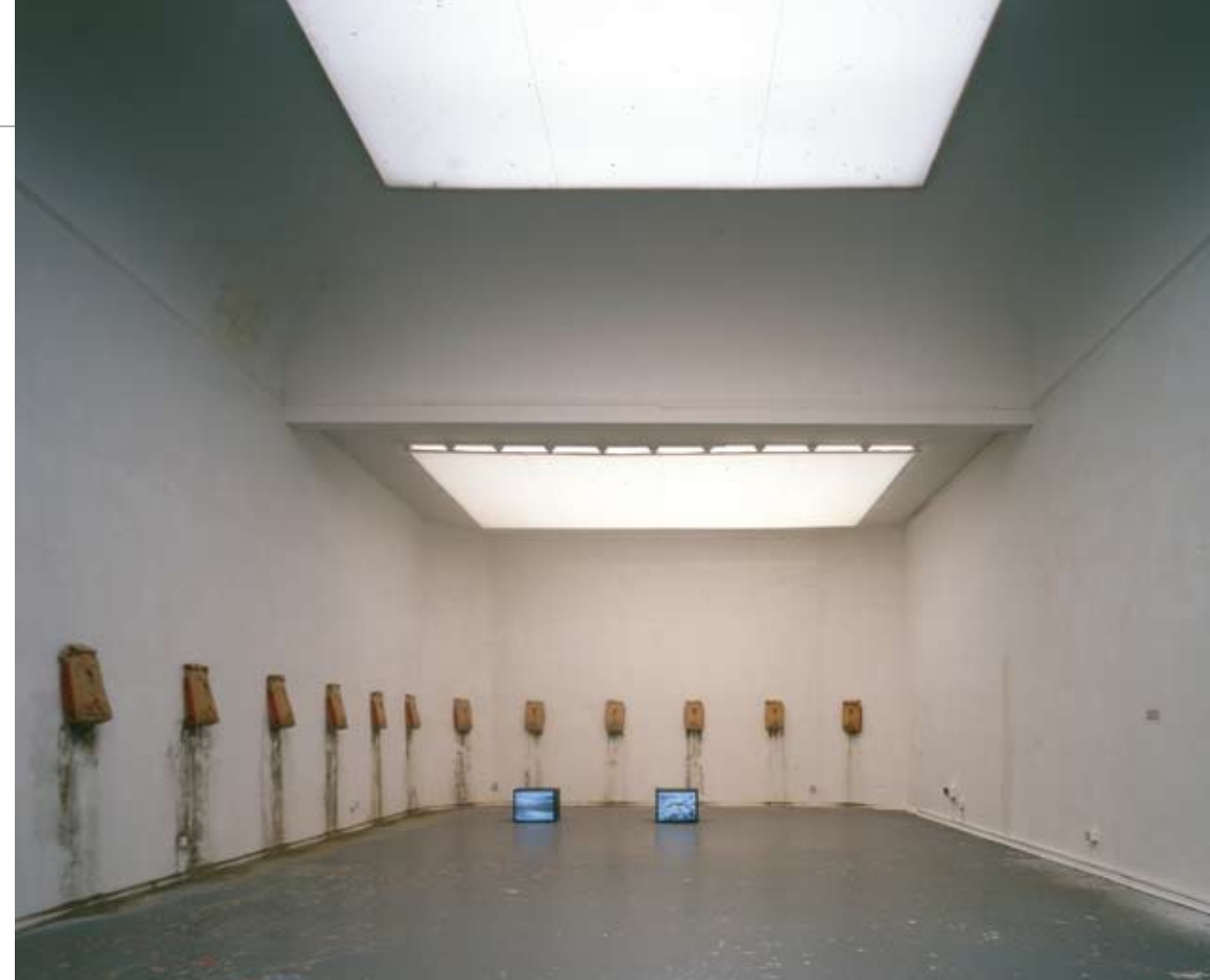
Dust/The beginning of the 21st century, 2005–2007

(1) Die Angaben variieren stark, siehe dazu etwa: Christoph Seidler, Ceausescus Wahnsinnspalast. „Ich brauche etwas Großes, etwas sehr Großes“ In: SPIEGEL online, http://einestages.spiegel.de/static/authoralbackground/1707/_ich_brauche_etwas_grosses_etwas_sehr_grosses.html